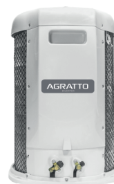
CONDENSADORA TOP DISCHARGE